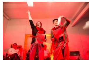
100 ans grève générale