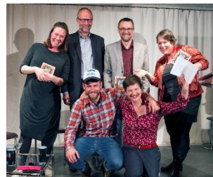
Nuit des musées 2018