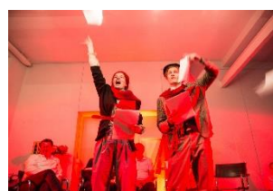
100 Jahre Landesstreik